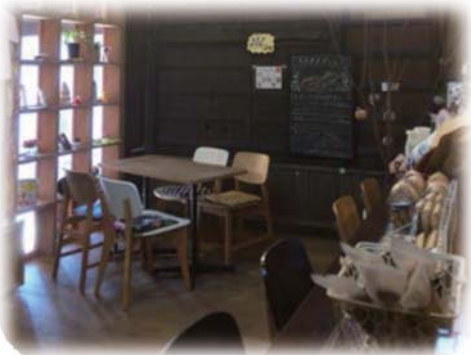
鞆の津ミュージアム+ C a f e